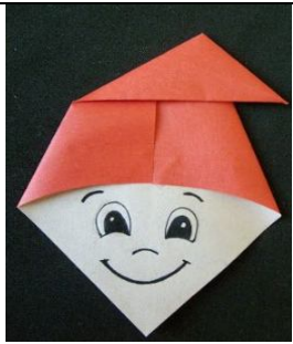
Modelo para fazer a dobradura do saci: